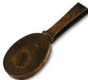
歩数をはかる 歩時計 江戸時代