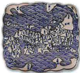
日本図皿 明治時代