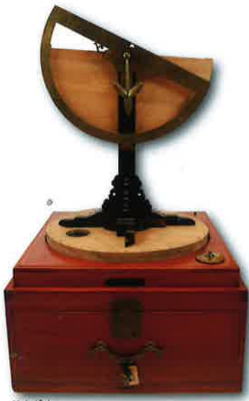
けんばん 権盤 江戸時代後期

本展では、日本で初めて実測による日本地図を作成し、測量史に大きな足跡を残す伊能忠敬の没後200年を記念し、江戸時代における測量術と天文学の歴史をご紹介します。