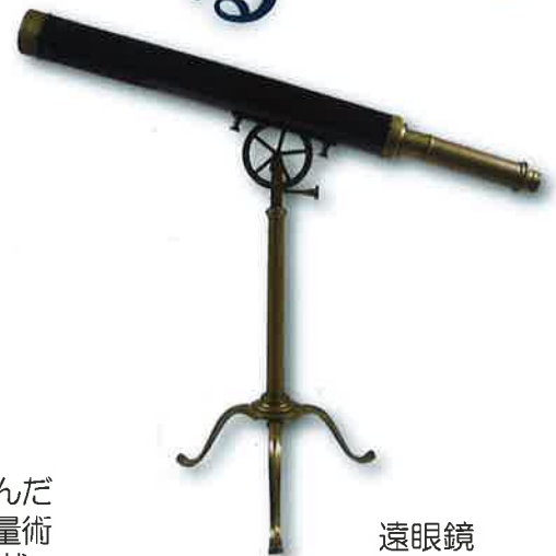
遠眼鏡 江戸時代後期（19世紀）