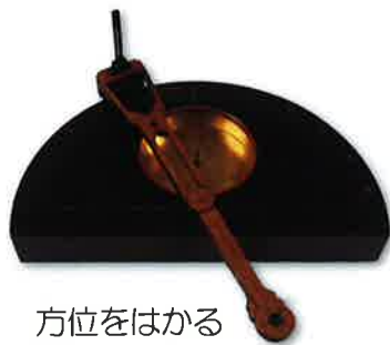
方位をはかる 半円方位盤 江戸時代