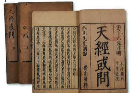
西洋の天文学を伝えた中国の書 『天経或問』遊子六著・西川正休訓点 1730（享保15）年刊