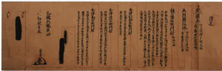
オランダ人に学んだと伝えられる測量術 清水流免許皆伝状 1693（元禄6）年