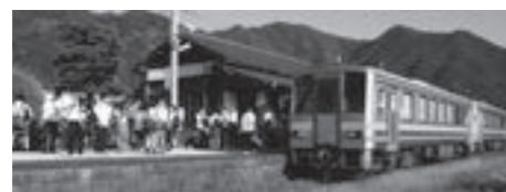
J R 因美線滝尾駅の通勤通学風景