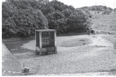
津山中核工業団地の調整池

Q 中核工業団地用の調整池は土砂が溜まり農業用水も足りない。早急な解決を。加茂川など川の樹木の撤去をし、日上地区の低い堤防のかさ上げを。