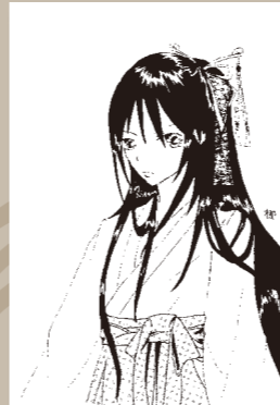
▲ペンネーム・柳 (中学1年・日上)