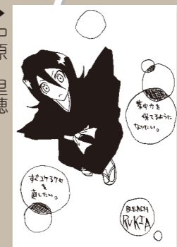
▶中原 里穂 (中学2年・美咲町)