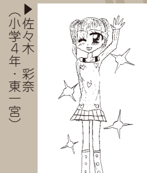
▶佐々木 彩奈 (小学4年・東一宮)