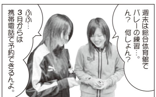
週末は総合体育館でハリーの練習... ふふ... 3月からは携帯電話で予約できるんですよ。 参照ホームページhttp://www.city.tsuyama.okayama.jp/sports/

体育施設の予約システムは3月1日(木)にリニューアルされます。これにより今まで時間が掛かっていたインターネットからの予約がスムーズになります。加えて新シス