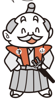
環境奉行「えご呂爺」

まずは全国平均をめざして、さらにマイバック運動の輪を広げていきましょう。市民のみなさん、今後もマイバックでの買い物にご協力ください！