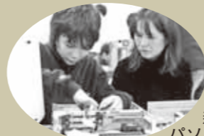
親子で パソコンの 解体組み立て