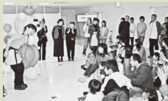
▲バルーンアートには人だかりができました