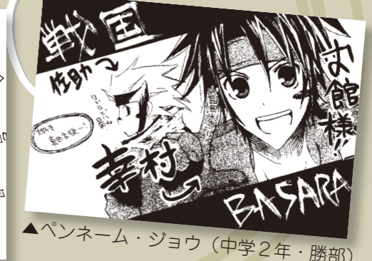
▲ペンネーム・ジョウ (中学2年・勝部)