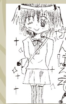
▼平井 美里 (小学3年・西下)