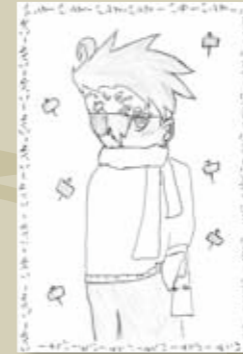
▲植月 晋 (小学6年・勝部)