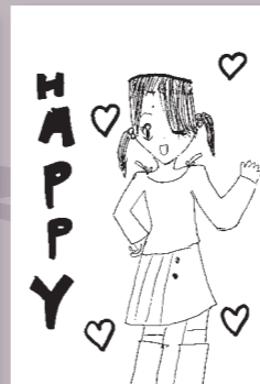
▲ペンネーム・ハッ ピークローバー (小学3年・河面)