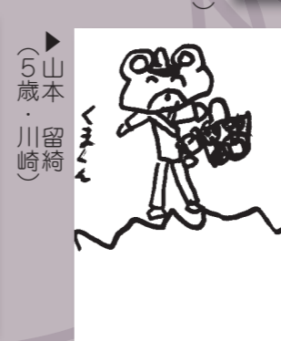
▶山本 川崎 (5歳・川崎)