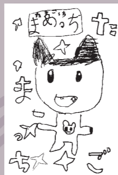
▲西山 文那 (小学2年・小原)