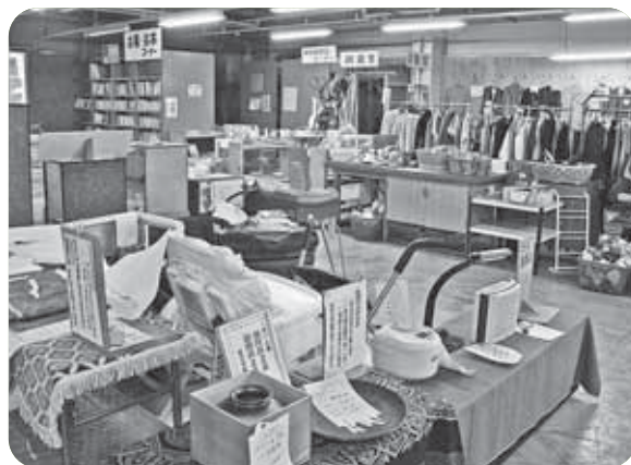
▲リユースプラザ津山「くるくる」