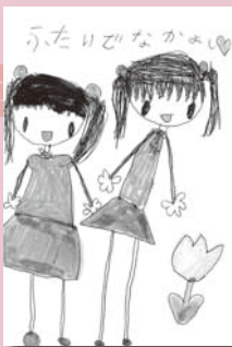
▼ 村上なお (5歳・院庄)