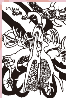
▲ ペンネーム・バジュラ (小学6年・下横野)