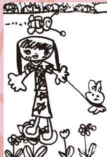
▲ 石井彩乃香 (5歳・沼)