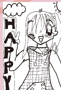
▲ ペンネーム・クロバー (小学4年・勝部)