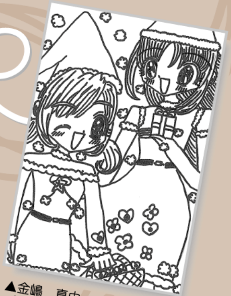
▲金嶋 真由 (小学4年・日上)