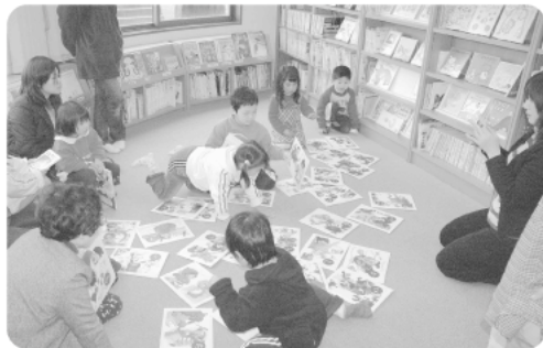
▲かるたなどいろいろな遊びもしますよ

「絵本って楽しい！」と子どもたちが本を好きになり、心豊かに育っていくことが私たちの願いです。