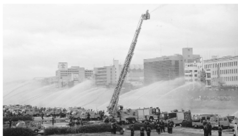
※北岸では、大正時代の手押しポンプによる放水実演もあります

ところ 吉井川河川敷 ※観覧は北岸でお願いします 内容 南岸 〓式典、ポンプ車・小型ポンプによるいっせいで着せ放水、北岸 〓ふれあいコーナー(やまめ、地鶏、うどん、たこ焼き、やきそばの屋台)、野菜の青空市、ふるまい甘酒、紅白もちプレゼント(10時と11時)、子どもへの風船プレゼント