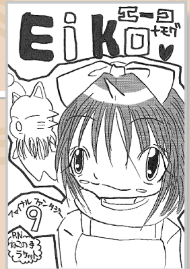
▲ペンネーム・ねこの手ラケット (小学6年・大田)