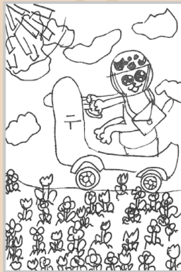
◀ 湯浅 美南 (小学2年・西下)

必ず自分の名前と住所、電話番号を書いてください。応募いただいたお便りは広報紙やホームページで紹介させていただくことがあります。