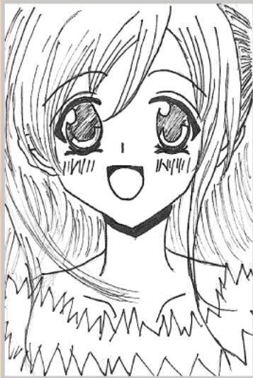
◀ペンネーム・ピー玉 (小学5年・上之町)