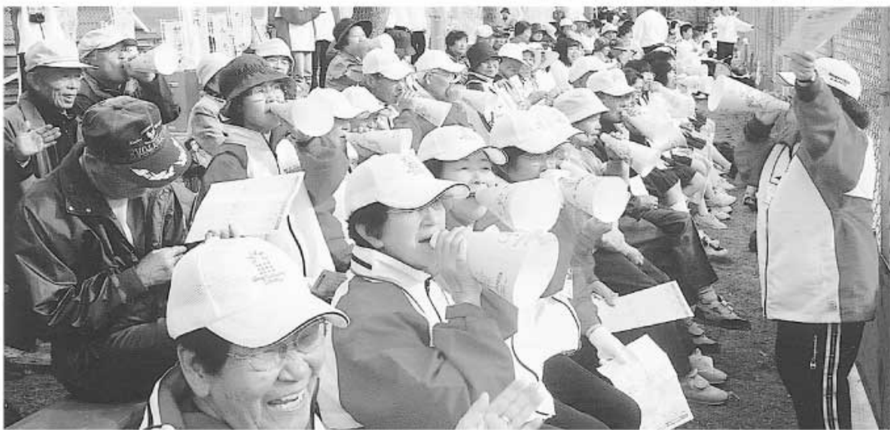
がんばれ！力いっぱい応援

加茂会場の開始式で、津山シティプラスアルプホルンクワイヤーによる演奏。「アルプホルン」は、加茂の木材で作られています