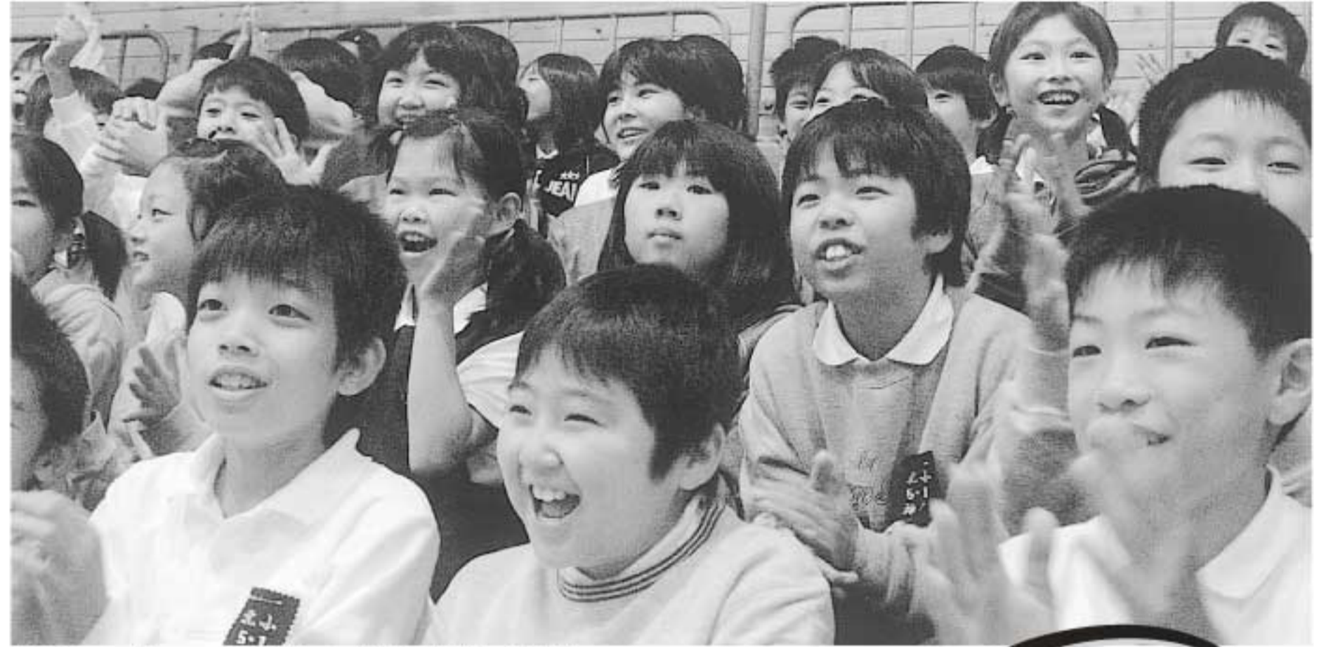
迫力あるプレーにくぎ付け!(北小学校5年生)