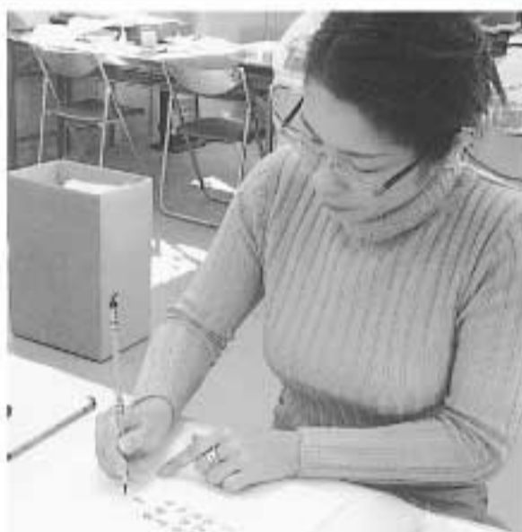
各会場では、筆耕ボランティアが活躍。慎重に、ていねいに…