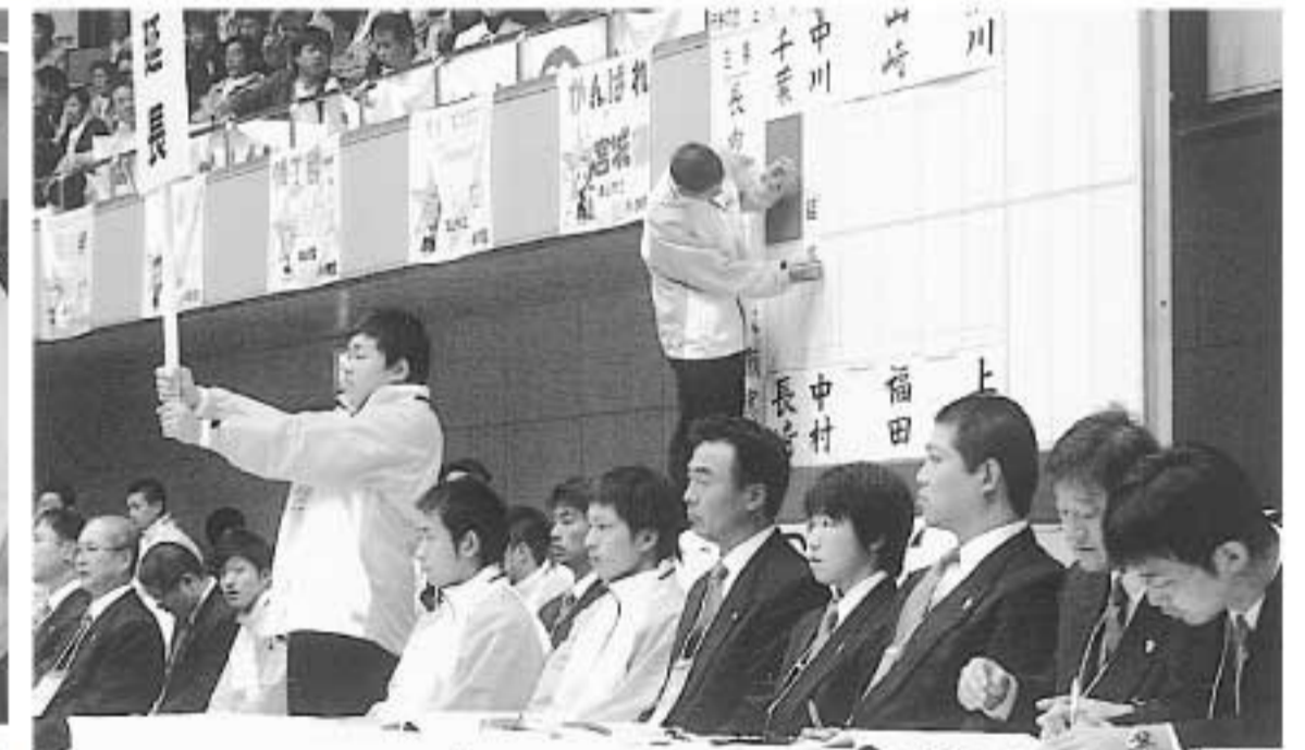
高校生の競技補助員は緊張した雰囲気の中、きびきびと任務に従事