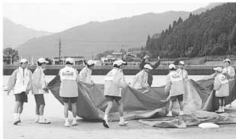
グラウンド整備も迅速に

加茂会場の開始式で、津山シティプラスアルプホルンクワイヤーによる演奏。「アルプホルン」は、加茂の木材で作られています