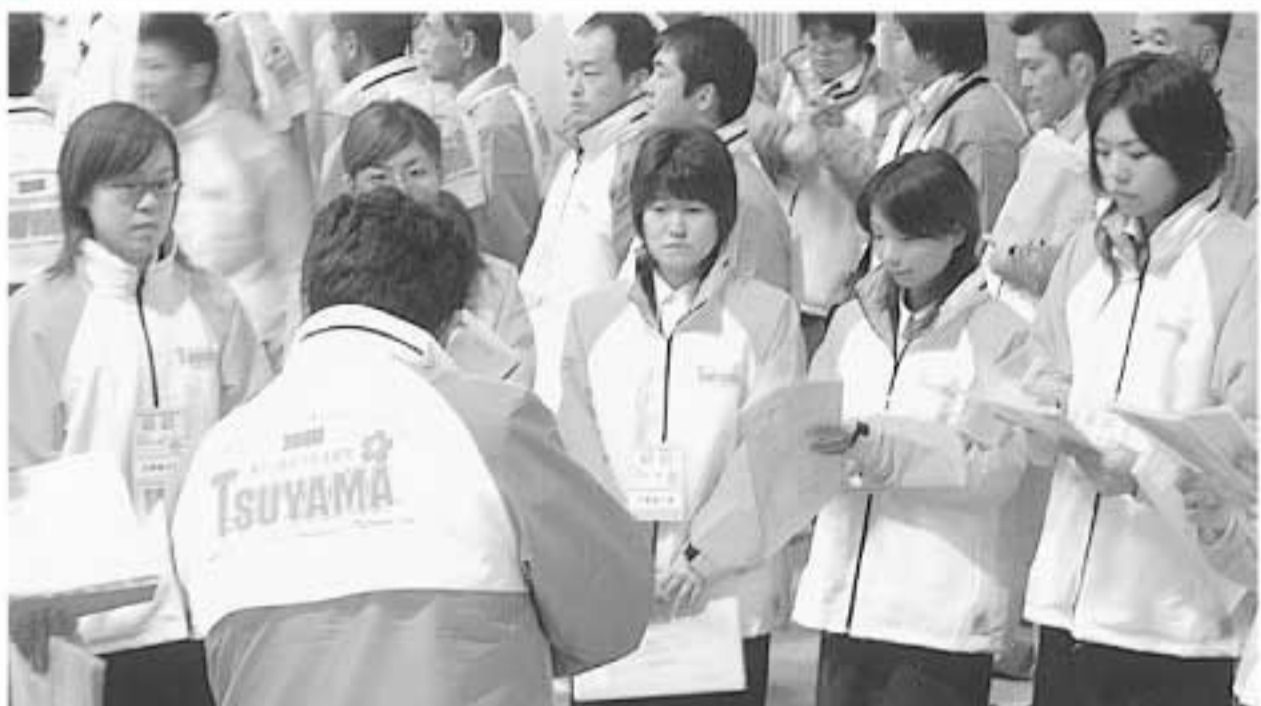
開催前、役割をもう一度確認