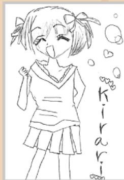
▲ペンネーム・☆きらり (小学3年・勝部)