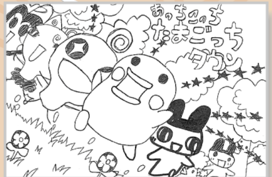
▲畝岡 歩未 (小学6年・二宮)