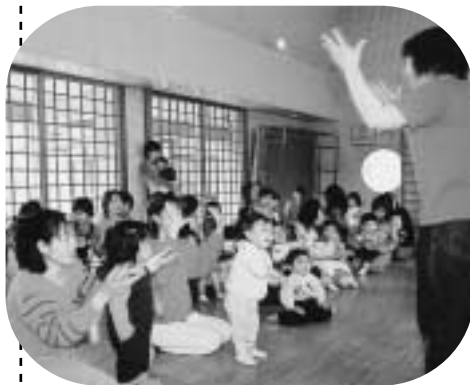
親子遊びのようす

子育てに不慣れで、悩んでいるお母さんやお父さんに子育てに必要なノウハウをご提供します。