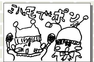
松永 夏奈 (小学2年・山北)