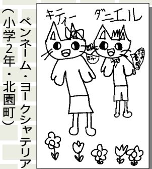
ペンネーム・ヨークシャテリア (小学2年・北園町)