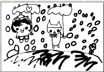
野津 夕芸 (小学2年・山北)

ご意見、クイズ、イラストは左のあて先へどうぞ。見本のとおり書くだけで着きます。イラスト以外はファクス、Eメールでも応募できます