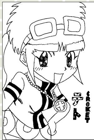
ペンネーム・リンたん (小学6年・下田邑)