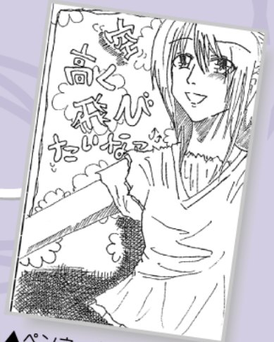
▶ペンネーム・まっチャ。 (中学1年・二宮)