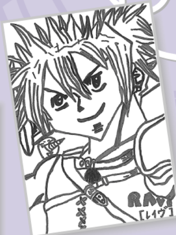
▲松本 勇大 (小学1年・市場)