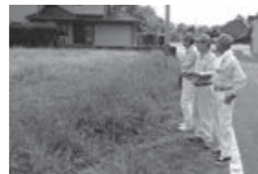
農地パトロールの様子

調査の際、皆さんの農地内に立ち入ることもあります。ご理解とご協力をお願いいたします。