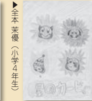
▲全本 茉優 (小学4年生)