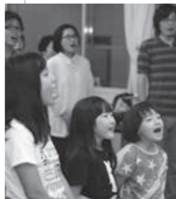
歌の練習をする合唱団のメンバー

大人も子どももみんな一生懸命に合唱練習をしていました。津山国際総合音楽祭での披露が楽しみです。