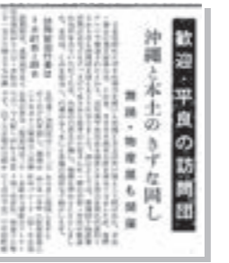
『広報つやま』昭和40年7月号から

全国で初めて、市議会として「本土復帰決議」をしたことに感謝の訪問をされた平良市長(当時)