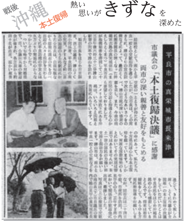
『広報つやま』昭和39年9月号から

全国で初めて、市議会として「本土復帰決議」をしたことに感謝の訪問をされた平良市長(当時)