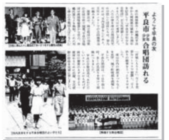
『広報つやま』昭和55年9月号から