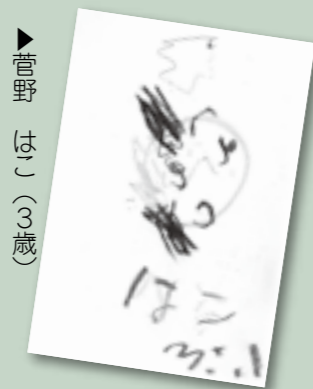
菅野 はこ (3歳)