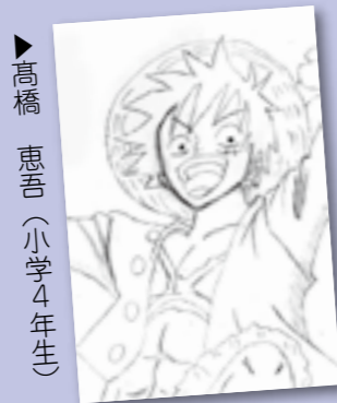
▶高橋 恵吾 (小学4年生)