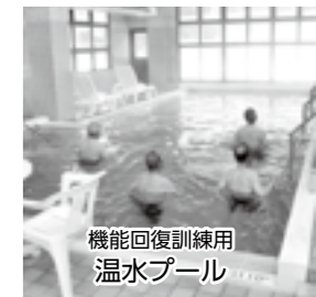
機能回復訓練用 温水プール