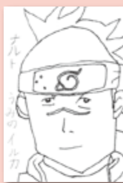
▲ペンネーム・ゆづき