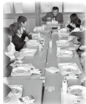
▲地域の人を招いての給食試食会