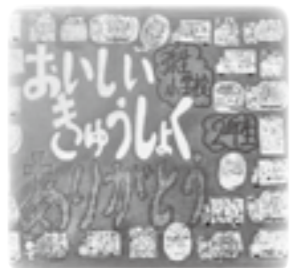
▲給食調理員への感謝の手紙