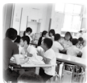
▲交流給食（栄養士・調理員を招いての会食や異学年交流）