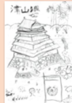
▶金森 大祐 (小学3年生)