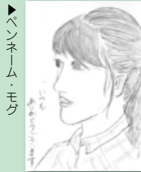
▶ペンネーム・モグ