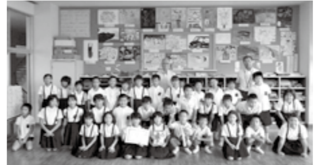
※ WBC杯とは「わたし(Watashi)もBookにChallengeするぞ」の略です

9月3日、市内の小学生がクラス単位で1週間の読書時間を競う「つやまっ子WBC杯」で、グランドチャンピオン(総合優勝)に輝いた加茂小学校3年生の表彰式が、加茂小学校(加茂町塔中)で行われました。 児童たちは、受け取った表彰状や優勝カップを手に、満足げな笑顔を見せていました。 本を読むことで、豊かな心や知力、さまざまな感情が育まれます。秋の夜長、気に入った本を見つけて、読んでみるのもいいかもしれませんね。