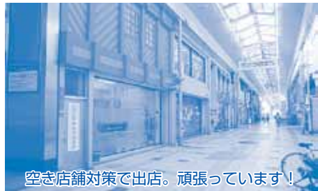
空き店舗対策で出店。頑張っています！

答弁 ↓ 市独自の学力調査は小学3年生と5年生全員を対象。5年生はすでに5月に実施し、3年生は3学期に計画している。より早い段階で子どもたちの学力の実態を把握し計画的、統計的に指導や学習改善につなげるのが狙い。義務教育9年間を見通した継続的な検証サイクルを確立させ、学力向上に取り組んでいきたい。