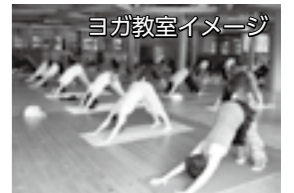
ヨガ教室イメージ

ダンスやヨガ、英会話などを通じて、高齢者・妊婦など、さまざまな世代の健康増進や子どもの教育をサポートする場を整備します。