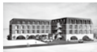
サービス付き高齢者向け住宅イメージ

高齢化とともに老朽化が顕著となっている商店街の拠点施設として、サービス付き住宅、健康に配慮したメニューを提供するレストラン、多目的ホールなどを兼ね備えた複合施設を整備します。