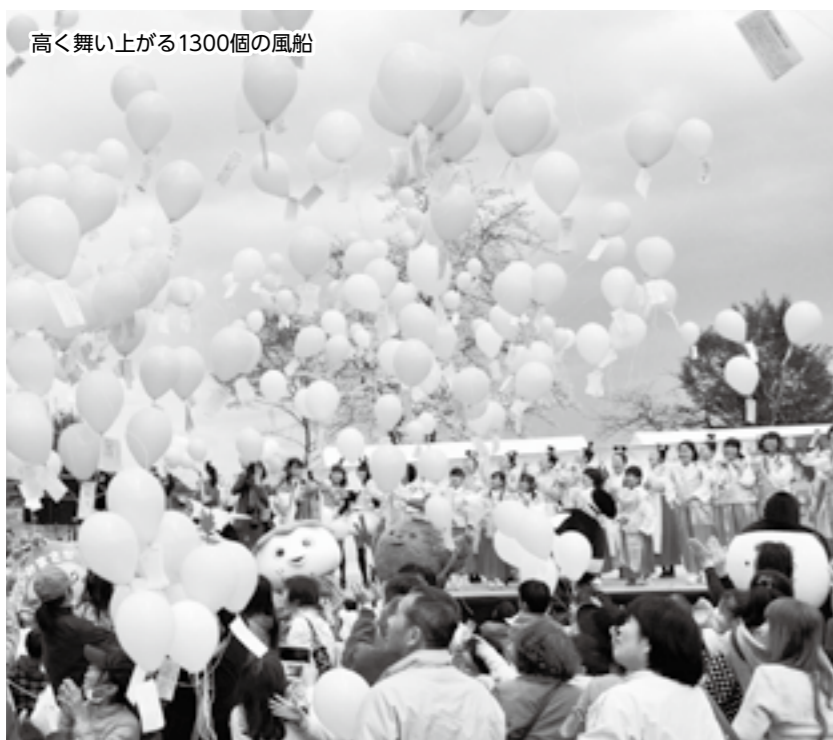
高く舞い上がる1300個の風船