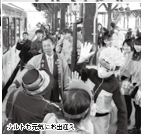
ナルトも元気にお出迎え