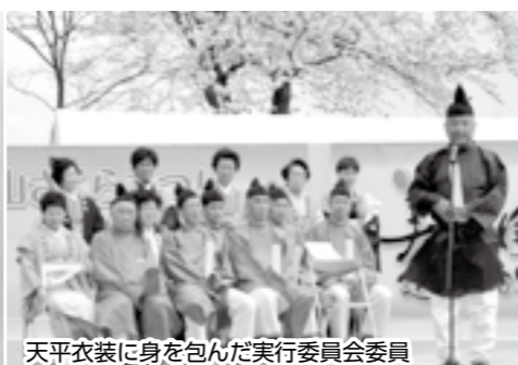
天平衣装に身を包んだ実行委員会委員