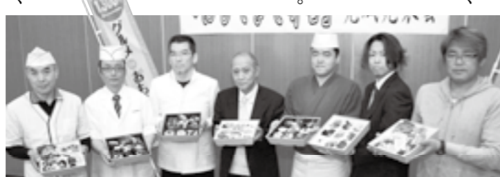
7つのおもてなし弁当が勢ぞろい

美作国建国1300年を記念した、ご当地弁当ができました。 地域の名物・名産食材を使って美作国ならではの弁当になっています。 行楽や各種会合などで、ご利用ください。