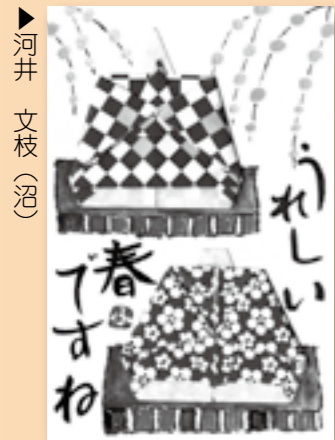
河井 文枝 (沼)