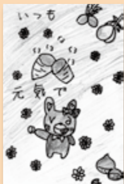
▶鉄先 未悠 (小学6年生)