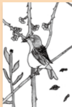
▶松本 七虹 (小学4年生)