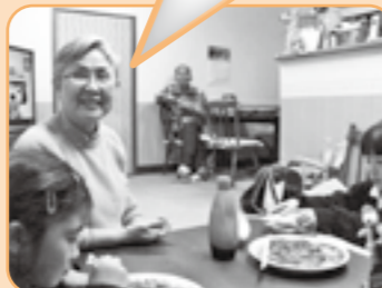
▲預かりサポートの様子