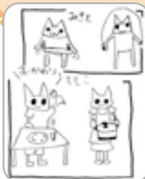
▲二人が描いたイラスト

楽しみながら、若い世代の子育てを手助けすることができて、とてもうれしいです。もっと、サポートしてくれる人が増えるといいですね。