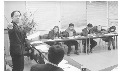
▲イベントの開催に向けて熱心な議論が交