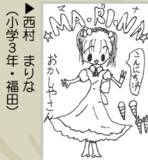
▶西村 まりな (小学3年・福田)