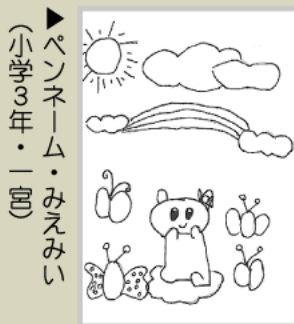
▶ペンネーム・みえみい (小学3年・一宮)