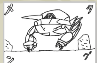
▶田口 裕也 (小学3年・押刈)