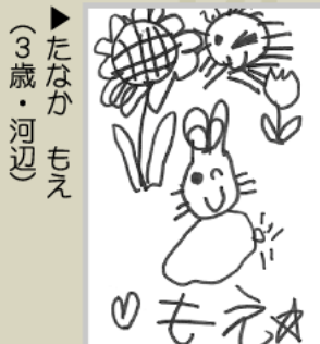
▶たなか もえ (3歳・河辺)