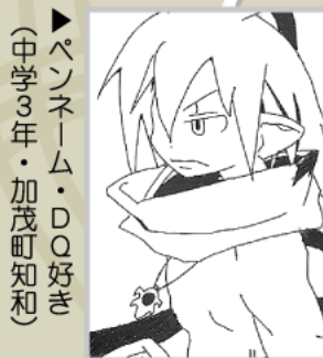
▶ペンネーム・DO好き (中学3年・加茂町知和)