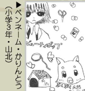
▶ペンネーム・かりんとう (小学3年・山北)