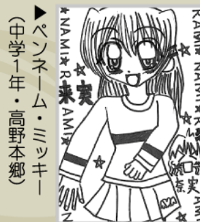
▶ペンネーム・ミツキー (中学1年・高野本郷)

●高校生まで ●色は白黒。サインペンなどかく鉛筆、ボールペンはだぞ ●テーマは自由 ●採用分には記念品を差し上げます ●はがきの表に住所、名前、学年(年齢)を書き、ペンネームもOKです ●敬称略