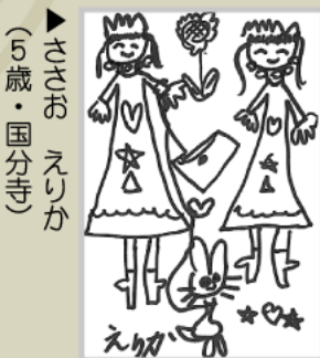
▶ささお えりか (5歳・国分寺)