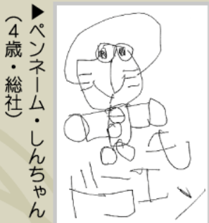
▶ペンネーム・しんちゃん (4歳・総社)

●高校生まで ●色は白黒。サインペンなどかく鉛筆、ボールペンはだぞ ●テーマは自由 ●採用分には記念品を差し上げます ●はがきの表に住所、名前、学年(年齢)を書き、ペンネームもOKです ●敬称略