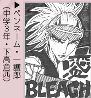
▶ペンネーム・一護郎 (中学3年・下高倉西)