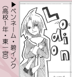
▶ペンネーム・碧インク (高校1年・東一宮)