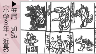
▶笹尾 知弘 (小学3年・近長)