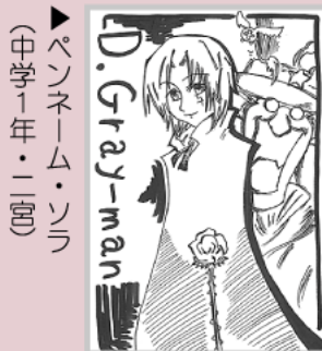
▶ペンネーム・ソラ (中学1年・二宮)