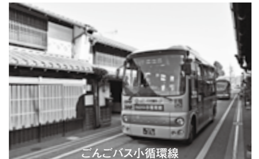
ごんごバス小循環線