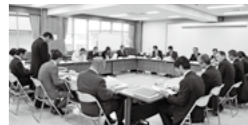
緊急雇用創出事業(美作国建国1300年記念事業)