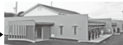
久米公民館 整備事業