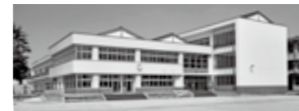
北小学校 耐震化事業