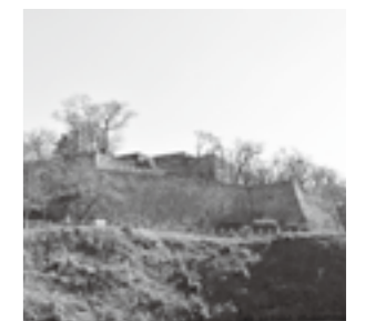
津山城跡整備事業