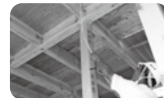
地域材利用新築住宅助成補助