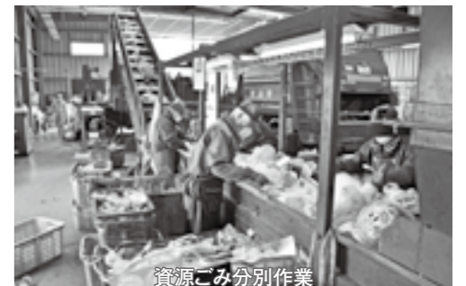
資源ごみ分別作業