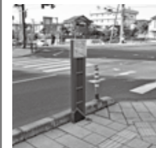
観光案内看板整備事業