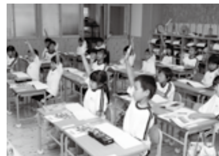
▲学校教育の充実(小学校の授業風景)

委員会は5人の教育委員で構成されています。教育委員は市民から選ばれた人たちで、次のような役割を担っています。 ●教育に関する事務の管理や執行の基本的な方針を決める ●規則や規程の制定や改廃を決める ●学校などの設置及び廃止を決める ●教育委員会や学校の人事に関すること ●教育に関する事務の管理や執行の状況の点検・評価をする