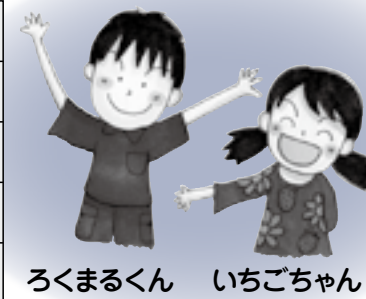
ろくまるくん いちごちゃん

わたしたちは、60分早く寝て、15分早起きして、しっかり、朝ご飯を食べるなど、基本的な生活習慣を身に付けるための取り組み「60・15キャンペーン」をみんなに呼び掛けているのよ。