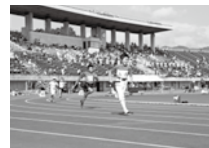
▲スポーツ振興(津山スポーツ祭)