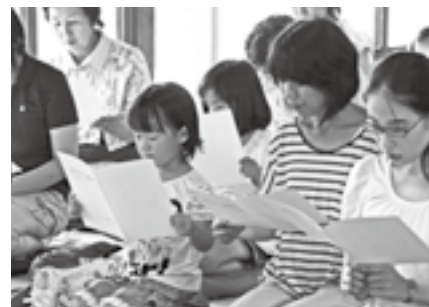
▲生涯学習(親子ろんご教室)