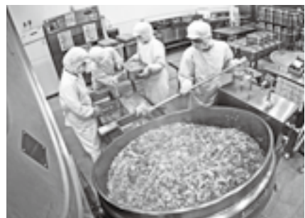
▲学校給食の提供(戸島学校食育センター)