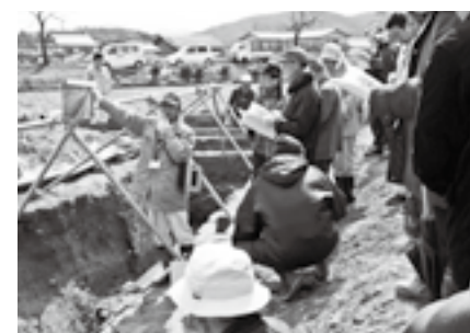
▲文化財の保護(遺跡の現地説明会)