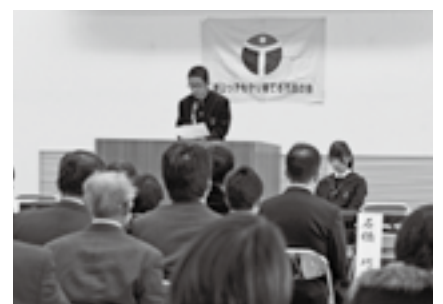
▲青少年健全育成(津山っ子こころのふれあいトーク)