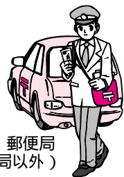
郵便局(簡易郵便局以外)