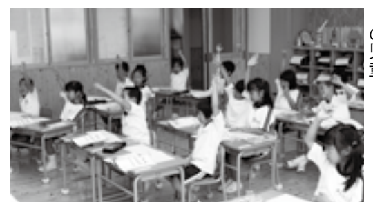
◀新校舎で学ぶ北小学校の児童

「つやまっ子・未来債」は市債の1つで、市民の皆さんからお預かりした資金を津山の未来を担う子どもたちのための事業の財源とし、今年度も小中学校施設耐震補強などの事業に活用します。