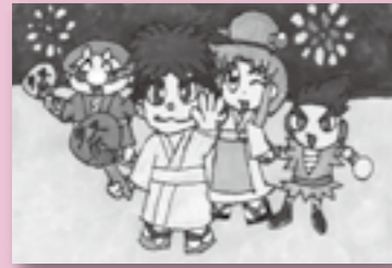
▲ペンネーム・ニャンコ