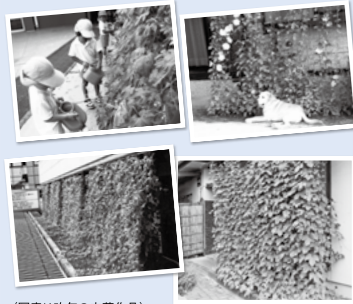
(写真は昨年の応募作品)

〒708-8501津山市山北520環境生活課 (市役所1階1番窓口) ☎32-2051