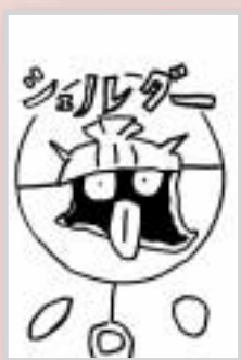
▶尾宮 遼平 (小学4年・中島)