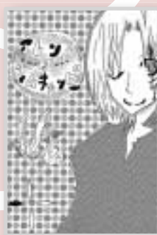
▶ペンネーム・幸手 (中学1年・京町)