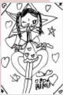
▶おんだ みく (5歳・野介代)