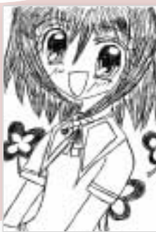
▶ペンネーム・クローバー (小学4年・高野山西)