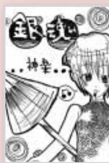
▶ペンネーム・もちだんご (小学6年・高野本郷)

●高校生まで ●色は白黒 ●サインペンなどでかく鉛筆・ボールペンはダメ ●テーマは自由 ●採用分には記念品を差し上げます ●はがきの表に住所名前学年年齢を書く ●ペンネームもOKです ●敬称略