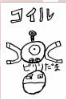
▶尾宮 琴音 (小学2年・中島)