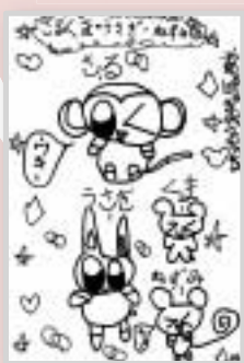
▶ペンネーム・ペコちゃんのほつぺ (小学2年・北園町)