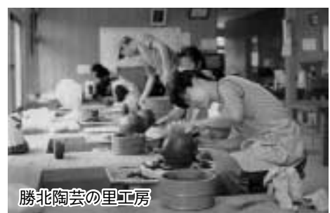
勝北陶芸の里工房

勝北陶芸の里工房、ハートピア勝北（文化センター、図書館・公民館）、勝北総合スポーツ公園は「ひとり文化、一スポーツ」の取り組みの中心施設となっています。