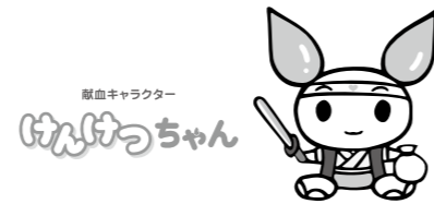
献血キャラクター