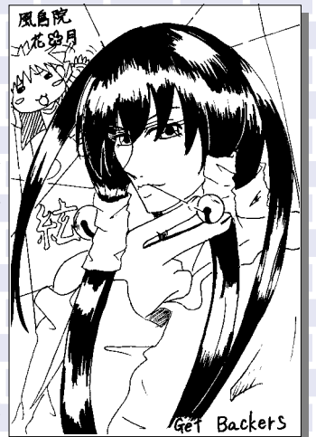
ペンネーム鉄鏝かるた(中学1年・総社)