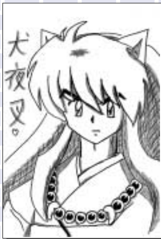
ペンネーム犬夜叉大ファン(中学3年・二宮)