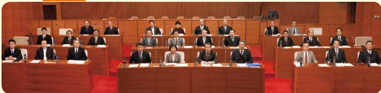
議長席からみた議場（本会議中は議長は議長席に着席しています）